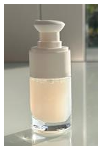
Extra Glow concentrate - Profil sensoriel